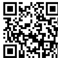
被災中小企業等支援金 市HP QRコード

申請に必要な書類は下記HPからダウンロードいただけます。 URL： https://www.city.shizuoka.lg.jp/381_000174.html