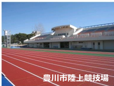
豊川市陸上競技場