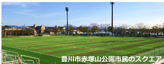
豊川市赤塚山公園市民のスクエア