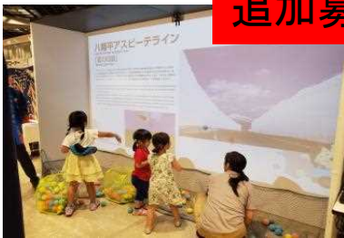
運動ソフトウェア