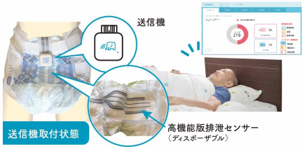
ワイヤレス排泄感知システム