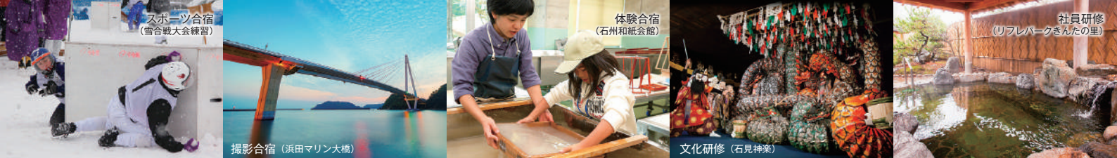
スポーツ合宿 (雪合戦大会練習)