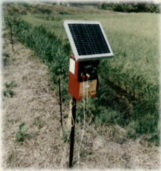
イノシシ対策用電気柵導入 (P5)