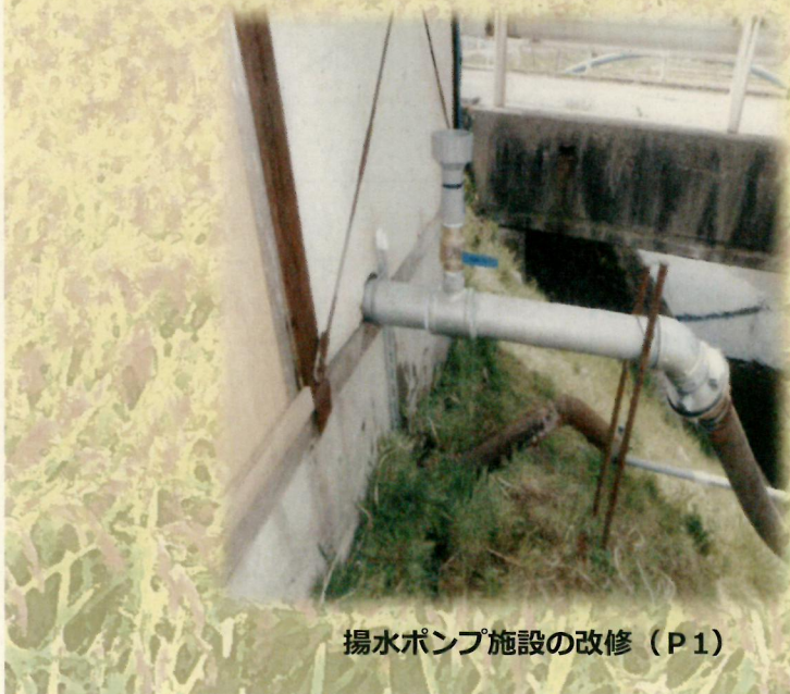
揚水ポンプ施設の改修 (P1)