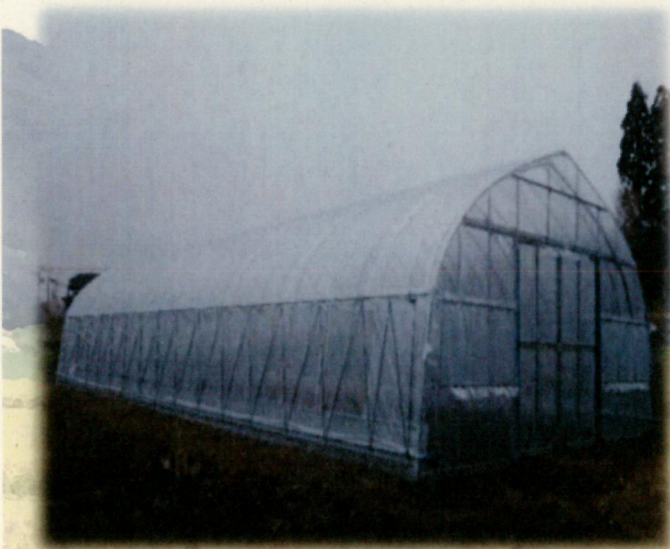
農業用ビニールハウス設置 (P3)