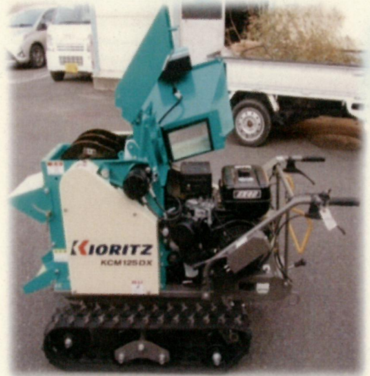
ウッドチップパー貸出 (P8)