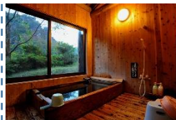
個室風呂付温泉への改修