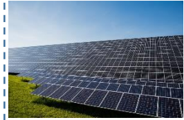
省エネ設備の導入

※消費税及び地方消費税額並びに他の補助金の交付の対象となる経費については補助対象外