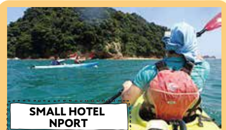
SMALL HOTEL NPORT

えびの市で空き家を活用した古民家カフェと農家民宿を開業。自然や文化、歴史を体験するきっかけとすることで、地元の活性化を目指しています。