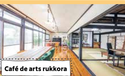
Café de arts rukkora

健康志向食品として注目されている地域の雑穀を復活させ、スイーツとして製造・販売することで地域雑穀の栽培・消費拡大を目指しています。