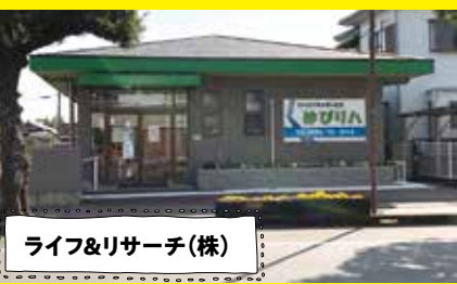
ライフ&リサーチ(株)

「美味しい地域素材を十分に活かす美しい商品づくり」をテーマに、食品製造販売と商品開発支援の事業を創業されました。