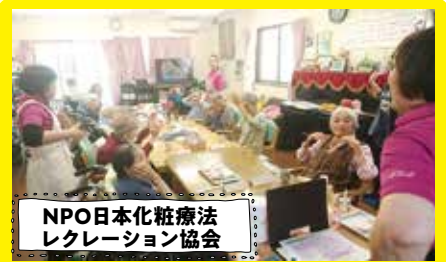
NPO日本化粧療法レクリエーション協会

自分で動くことができるようになるために行う機能訓練は、社会からの必要度が増えています。高齢率の高い国富町でリハビリ通所施設をオープンされました。