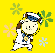
一栄マリンシステム

若い世代の定住・移住を推進するため、子育て世代の支援(学習支援、自然体験活動等)やITを活用した情報発信に取り組み、地域の活性化を目指しています。