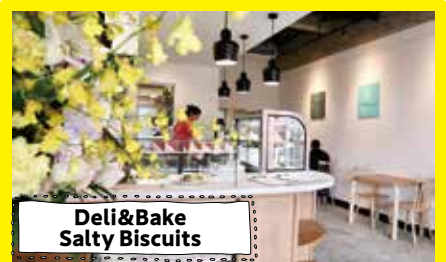
Deli&Bake Salty Biscuits

水産業の担い手不足を解消するため、省力化や生産性改善を図るとともに、安定した収入の見込める牡蠣養殖を事業化しました。