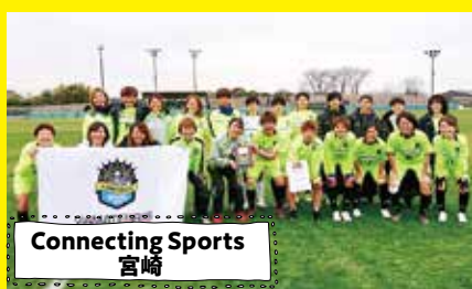
Connecting Sports 宮崎

ママの一人時間を確保(託児機能付き)して、サルサダンス・コーチングにより心と身体の健康維持・増進を図ります。