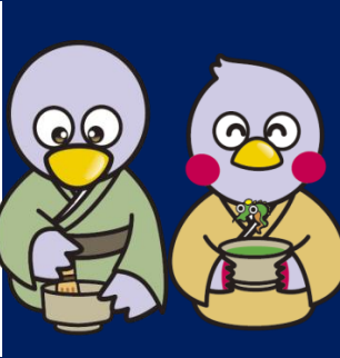
埼玉県のマスコット コバトン・さいたまっちゃん