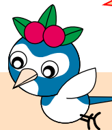
環境維新・高知市 マスコットキャラクター 「ケーちゃん」