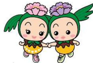
東松山市マスコットキャラクター

中心市街地の活性化を図るために空き店舗に 新規出店する個人、商店街団体等に補助金を交付します！