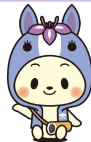
知立市マスコットキャラクター 「ちりゅっぴ」

申請額が予算額を超えた時点で受付終了いたします。 申請様式に関しては市ホームページをご覧ください。