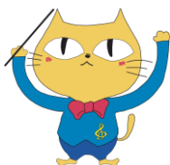
玉名市マスコット タマにゃん